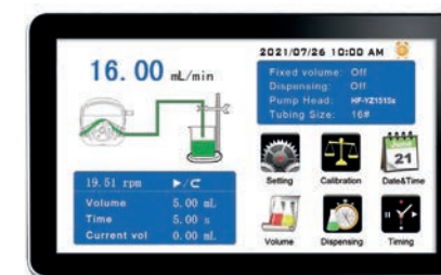
Ecrã tátil de fácil acesso e muito intuitivo

Bombas altamente fiáveis, com 3 anos de garantia. Aptas para todo tipo de fluidos, permite níveis muito diferentes de caudais (desde 0,0002ml até 28l/min), volumes ou o uso de diversas cabeças, mantendo a precisão original.